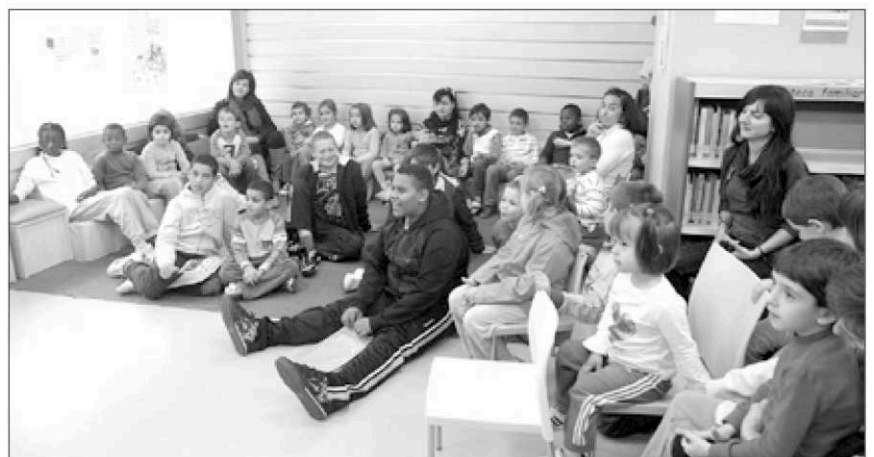
Los niños siguieron con interés los relatos de sus compañeros.