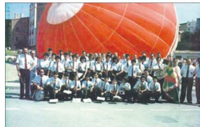
Los componentes de la Banda en 1986. WWW.BANDAMUSICAHUESCA.COM

trayectoria, instrumentos musicales, fotografías y el vestuario de los músicos.