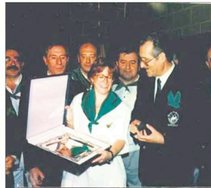
Con la Parrilla de Oro. BANDA MÚSICA