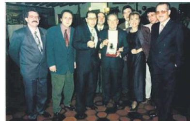
La Banda recibió la Pajarita de Oro en 1993. WWW.BANDAMUSICAHUESCA.COM

Y, más adelante, coincidiendo con Santa Cecilia (patrona de los músicos; se celebra en noviembre), la Banda de Música organizará una exposición sobre sus veinticinco años de historia. La muestra incluirá algunas cartas y parrillas empleadas en esta ya larga