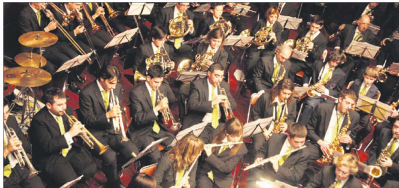
La Banda de Música, en un concierto de su última etapa. D.A.