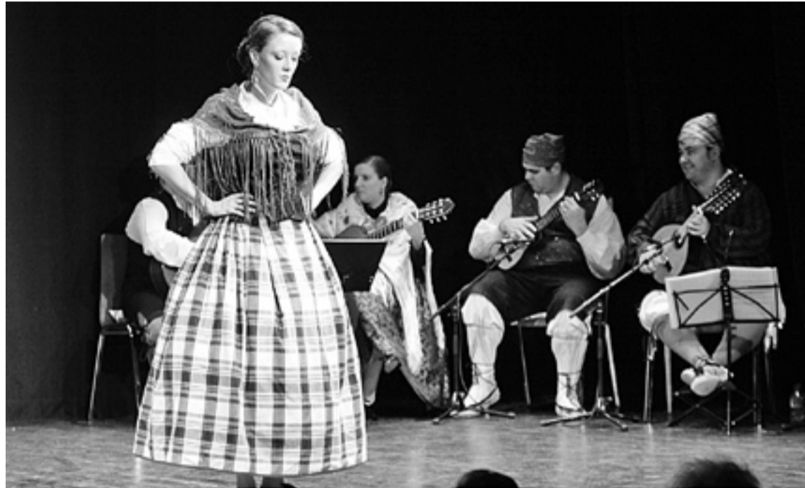
Una cantadora, ayer en su actuación en el Centro Cultural del Matadero.

Fueron dos jornadas especiales para los más de 320 cantadores y