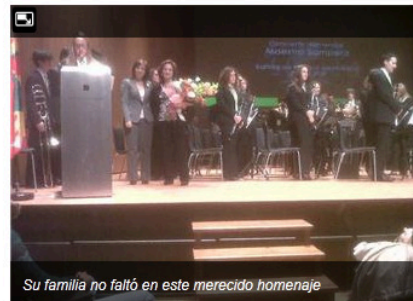
Su familia no faltó en este merecido homenaje