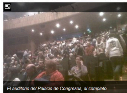
El auditorio del Palacio de Congresos, al completo