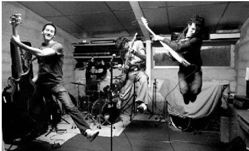
Los cuatro componentes de Dexden, en su local de ensayo.

La próxima cita será este sábado, 5 de mayo, en Medina del Campo. Allí se enfrentarán a ocho grupos pertenecientes a dos zonas. "Tocaremos la canción que enviamos y otras dos recién compuestas", indica Diego Gracia, contento por tener la oportunidad de compartir escenario con Celtas Cortos, que actuará en la sesión junto a las bandas jóvenes. Los músicos os-